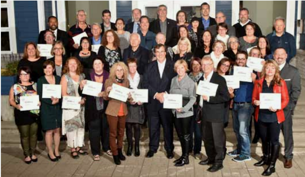
Les membres accrédités RSSMO accompagnés du ministre François Blais.