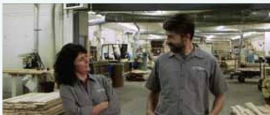
Image tirée de la capsule « Une entreprise ouverte à l'emploi des femmes »

Le projet Égalité pour l'emploi des femmes au sein de la MRC d'Arthabaska , réalisé en partenariat avec Services intégrés pour l'Emploi, la Table de concertation du mouvement des femmes du Centre-du-Québec (TCMFCQ) et la MRC d'Arthabaska, a retenu l'attention du jury et s'est vu décerner le prix Thérèse-Casgrain 2017 dans la catégorie égalité économique. Cette reconnaissance vise à souligner la contribution des organismes communautaires, publics, parapublics ou privés à l'atteinte de l'égalité entre les femmes et les hommes partout au Québec. Le projet visait à faciliter l'intégration des femmes au sein des entreprises manufacturières du territoire, tout en répondant aux besoins de main-d'œuvre du milieu. Après consultation des entreprises pour poser un diagnostic, six capsules vidéo ont été produites pour inciter les employeurs à embaucher des femmes. Un guide d'intégration de même qu'une offre de soutien et d'accompagnement ont aussi contribué au succès du projet.