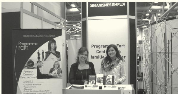
Images offertes par le Centre de la famille Valcartier