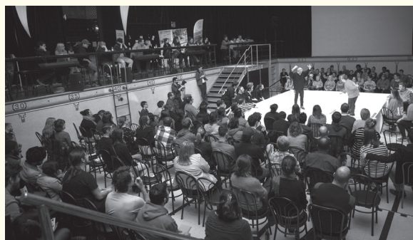
Match Impro-Emploi du PITREM